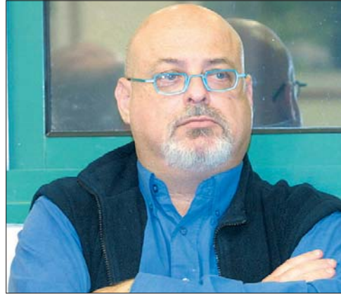
מלצר. "בשביל זה יש בית משפט"

רסם את הספר, זאת תוך הפרת זכויות יוצרים. לדברי לילינג גם התוצאה הסופית מאכזבת מאוד. בכתב התביעה מפורטים הסכומים אותם דורשת לילינג לקבל לידה: לבד משכר עבודתה, 40,500 ש"ח, היא דורשת כאמור פיצוי בגין הפרת זכויות היוצרים של התובעת בסכום של חצי מיליון ש"ח, בגין הפרת הזכויות המוסריות סכום של 100 אלף ש"ח, פיצוי בגין עוגמת הנפש שנגרמה לתובעת בסכום של עשרת אלפים ופיצוי בגין המוניטין שהייתה התובעת מפיקה מהקרדיטים בגין מאמריה, בסכום של עשרת אלפים ש"ח. לצורכי אגרה בלבד הוגשה התביעה על סך של 300 אלף ש"ח, אך בית המשפט התבקש לפסוק עד כה ניסו הצדדים להגיע לפשרה באמצעות "מגשר". על פי כתב התביעה, על אף שמלצר לא שילם עבור עבודת הכתיבה הוא עשה במאמצים כבשלו ופ-